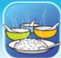
กินของร้อน ใช้อินทกลาง