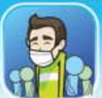
ใส่หน้ากากอนามัย เมื่ออยู่ในที่แออัด

ผลิตภัณฑ์ที่เกี่ยวข้อง เช่น ยาลดไข้ ยาบรรเทา-รักษา, หน้ากากอนามัย, เบ้าทรายหรือกลสังมือ อยู่ในความรับผิดชอบของ อย. หากมีข้อสงสัยหรือพบปัญหาการผลิตไม่ได้คุณภาพ สามารถสอบถามหรือร้องเรียนได้ที่สำนักงานสาธารณสุขจังหวัด หรือที่สายด่วน อย. 1556 อีเมล: complain@fda.moph.go.th หรือที่ สำนักงานคณะกรรมการอาหารและยา (อย.) ตู้ ปณ. 52 ปณท. นนทบุรี 11000