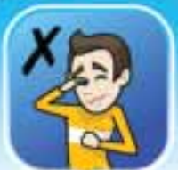
อย่าจมน้ำเย็นตา ถูก ปาก ทาถึงไม่ล้างหรือทำความสะอาดมือ