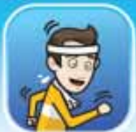
ออกกำสัทม