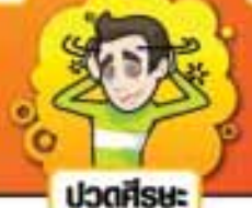
ปวดศีรษะ