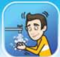
ล้างมือบ่อย ๆ