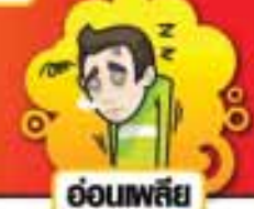
อ่อนเพลีย

ส่วนใหญ่รักษาหายได้เป็นปกติแบบการรักษาทั่วๆไป บางรายเท่านั้นที่มีโรคแทรกซ้อน เช่น ปอดบวม ปอดอักเสบ ซึ่งเป็นเหตุของการเสียชีวิตได้