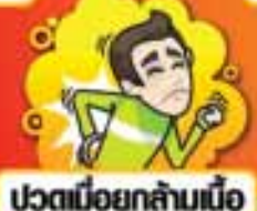
ปวดเมื่อยกล้ามเนื้อ